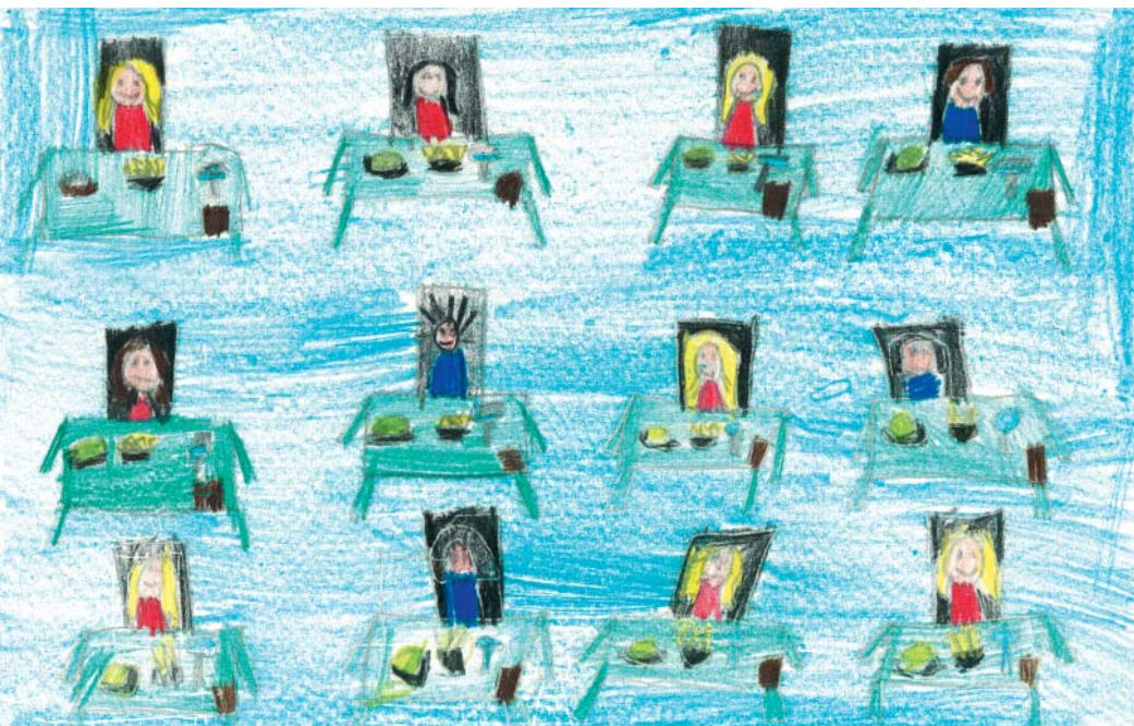
Zeichnung: Esra Aslan, Primarschule Kleinhünigen